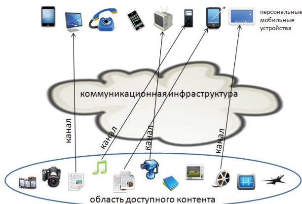
Рис. 2. Процесс передачи данных в традиционной телекоммуникационной системе

рования для передачи данных специального назначения между передатчиком и приемником, не находящимися в пределах радио-видимости. Перечисленные особенности позволяют говорить о появлении новой виртуальной сущности — программно-определяемого канала передачи данных [14].