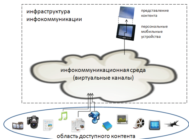
Рис. 3. Цифровая инфокоммуникационная среда

Главным достоинством программно-определяемого канала передачи данных является возможность гибкой адаптации к радиообмену с различными унаследованными системами без модернизации оборудования, а также потенциально большое количество одновременно поддерживаемых протоколов локационных, навигационных и коммуникационных систем, что особенно актуально при использовании оборудования в различных географических зонах. Это также является предпосылкой к импортозамещению.